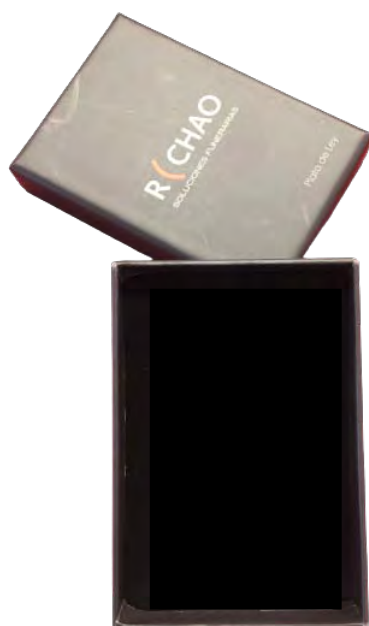
Relicario joya doble Ala 7779034